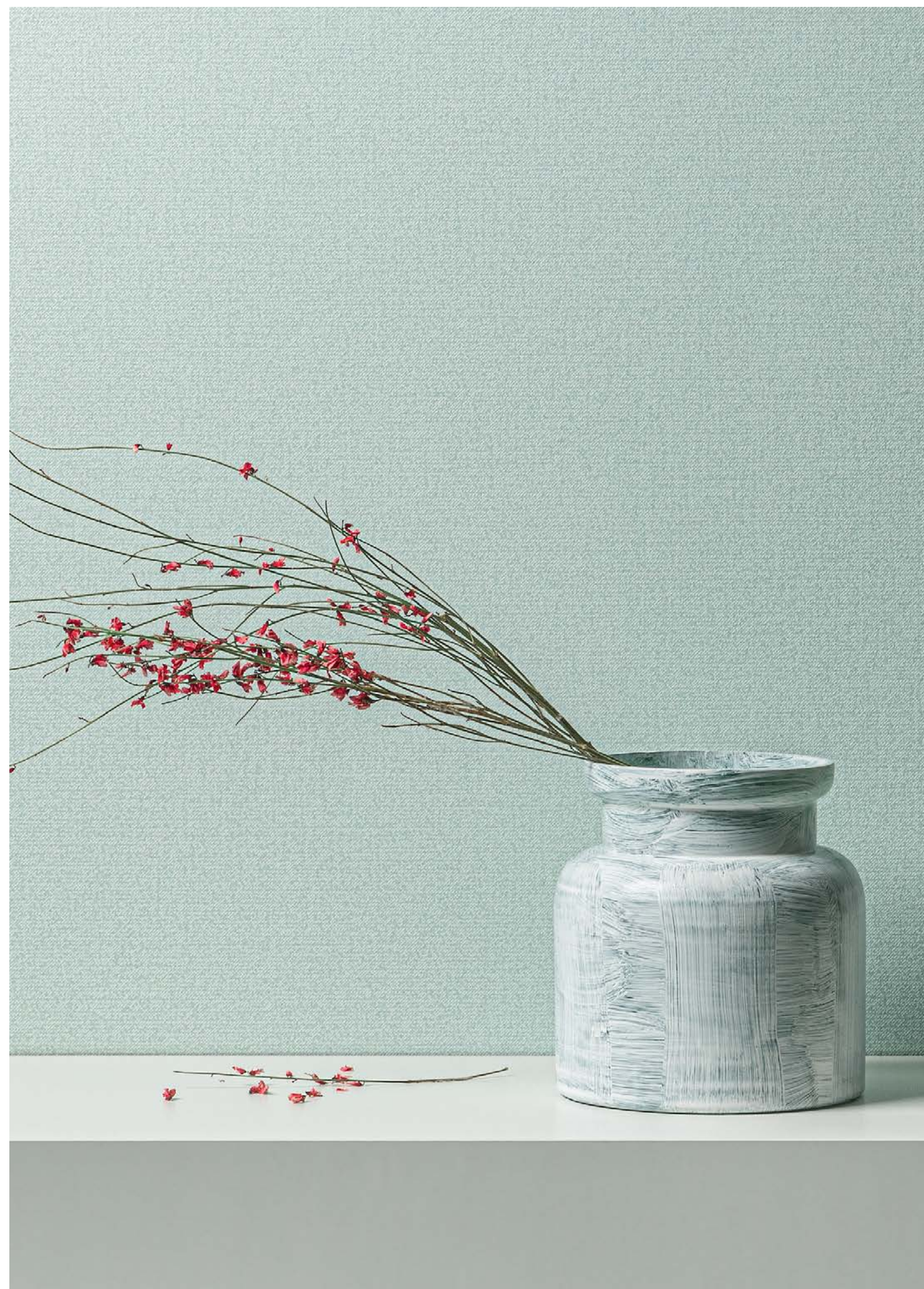
COTTON | PLAIN COTTON