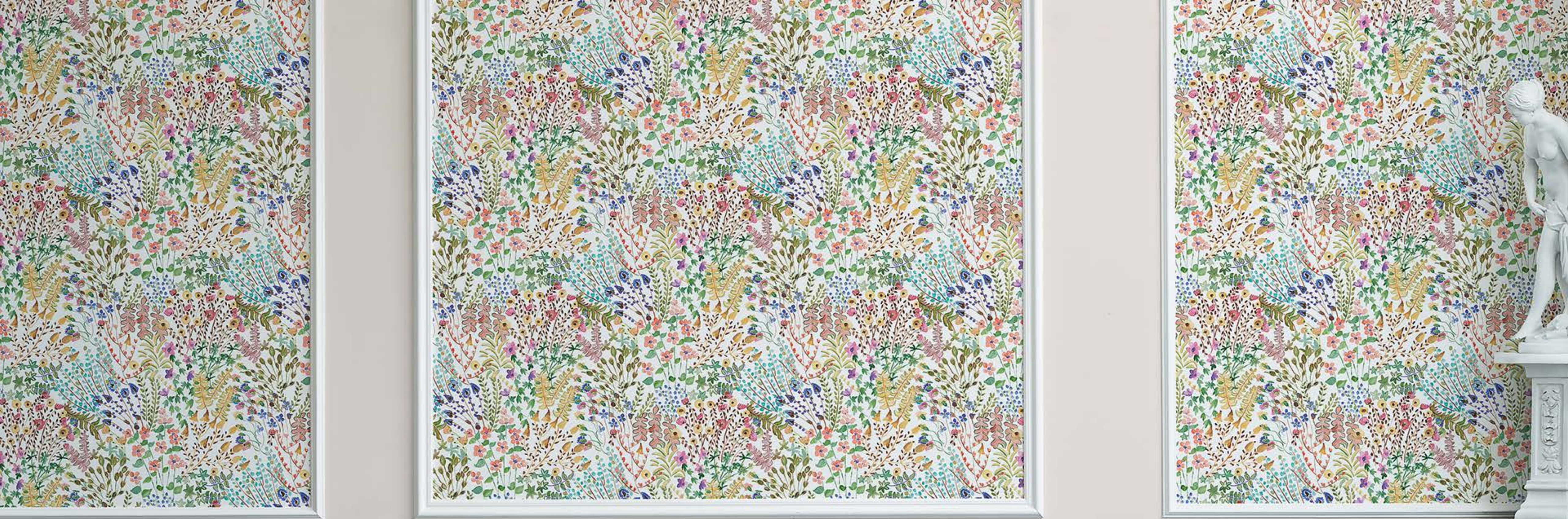
FLOWER STORY PM1 001