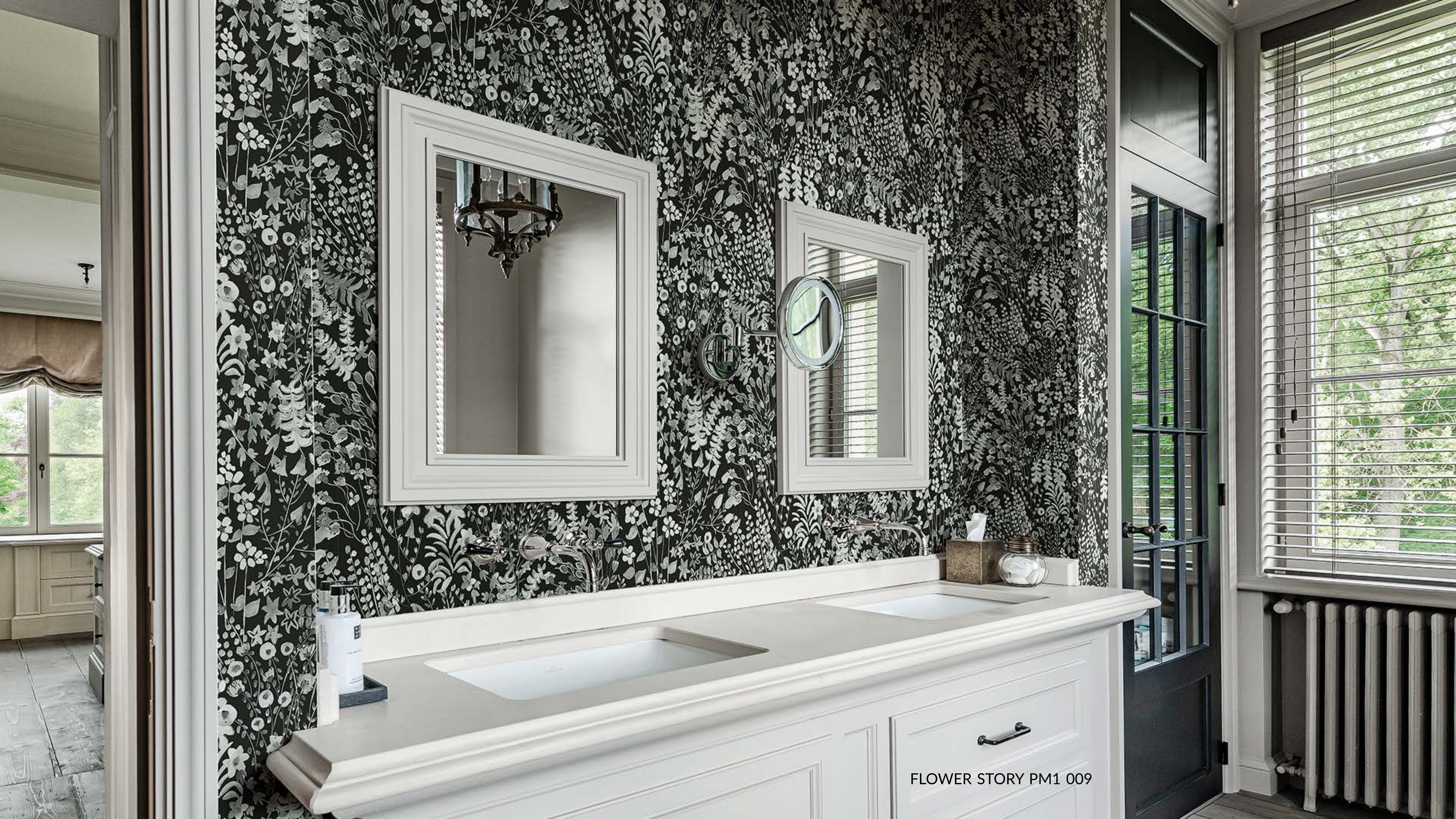
FLOWER STORY PM1 009